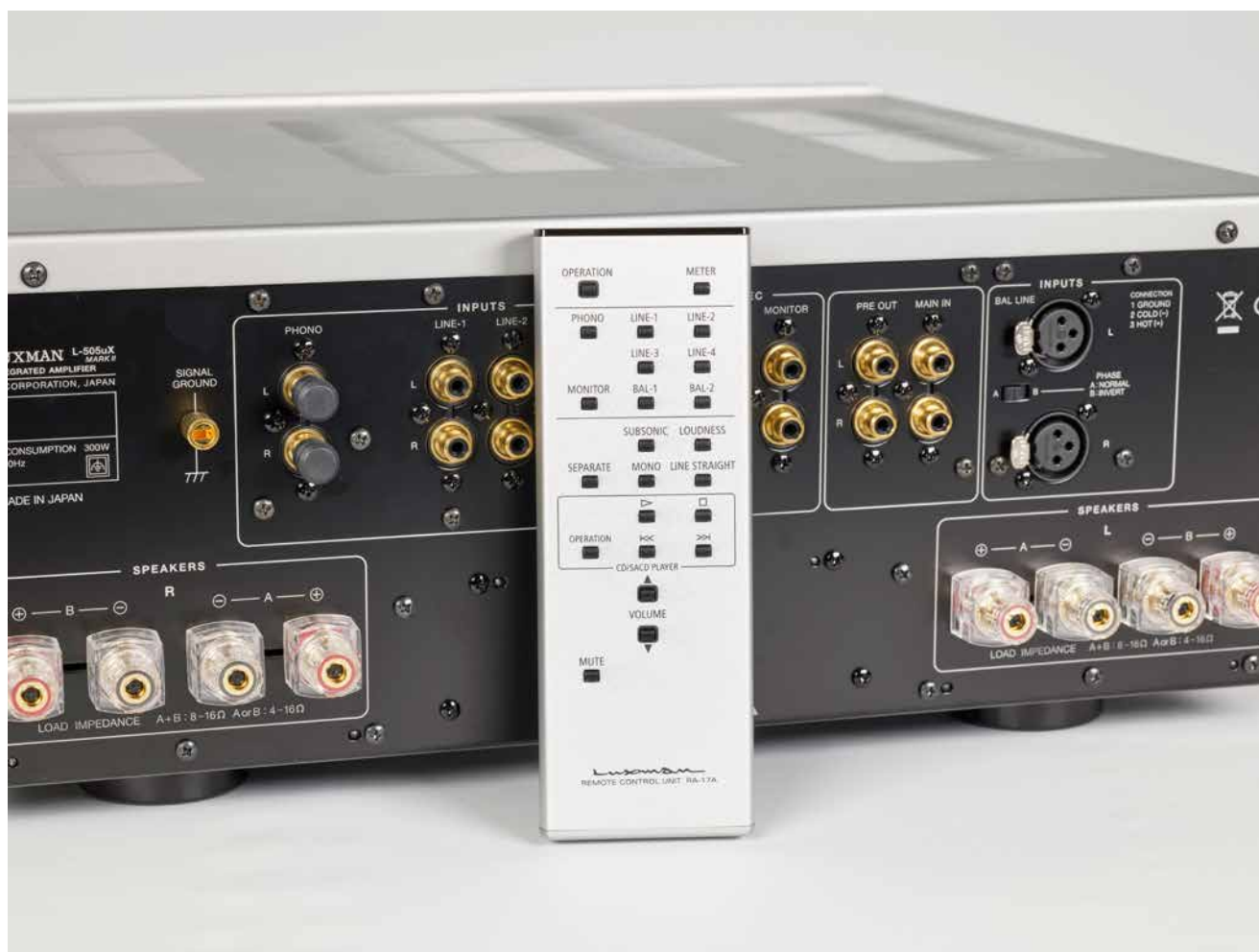
Schwere Qualität der Anschlüsse: Auch da, wo kein Licht hinscheint, glänzt Luxman.

Regelprozess in die Vorstufe eingreift und eine präzise und verfälschungsarme Pegel- und Balanceeinstellung ermöglicht, vermochte an der beherzt vorgetragenen Forderung „Leiser, bitte!“ nichts zu ändern. Immerhin ist auch das Herunterdrehen des Reglers ein haptisches Erlebnis, dreht es sich doch angenehm souverän und insgesamt mit dem Gefühl, dass man beim Luxman an nichts gespart hat.